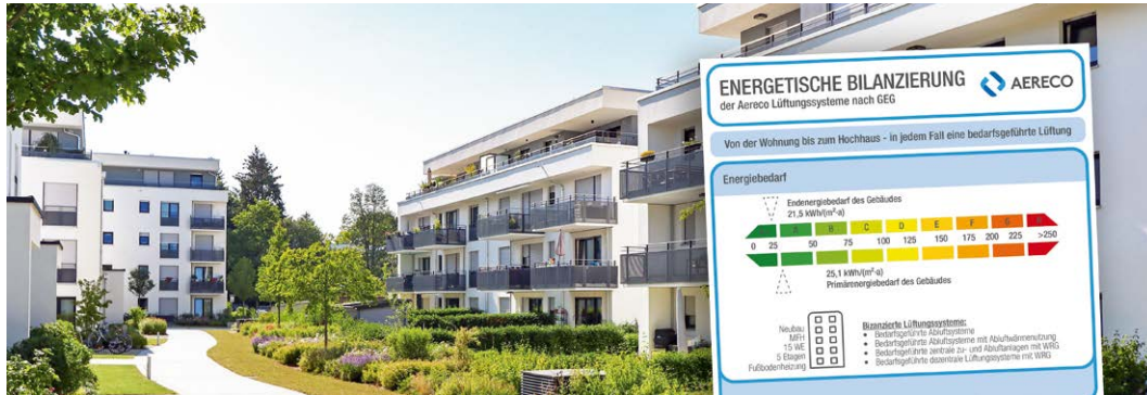
Dank der Kombination aus Bedarfsführung und Abluftwärmenutzung verbessern Aereco Lüftungssysteme AWN die energetischen Bilanz eines Gebäudes sowohl im Neubau als auch in der Sanierung. © Aereco

Mit der Abluftwärmenutzung von Aereco wird eine hervorragende energetische Optimierung im Geschosswohnbau erreicht. Sowohl in der Sanierung als auch im Neubau.