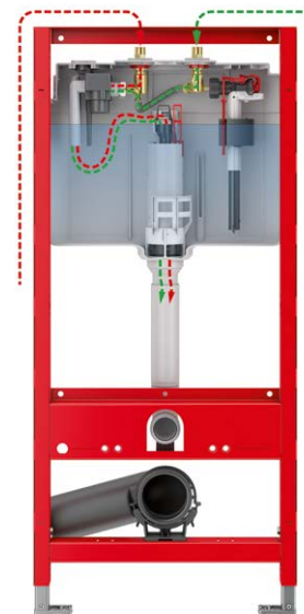
Mit dem TECEprofil WC-Modul mit integrierter Hygienespülung lassen sich Stagnationen sowohl im Kalt- als auch im Warmwassernetz vermeiden. Das Spülwasser wird dabei direkt über den Spülkasten entsorgt.

Dank der Integration in den Spülkasten sind zusätzliche Rohre und Revisionsöffnungen weggefallen, was eine Senkung der Baukosten mit sich brachte. Die Hygienespülung wird als letzter Verbraucher