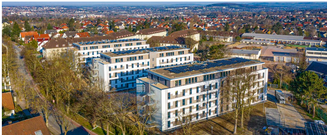
Für einwandfreies Trinkwasser in den insgesamt 360 Apartments sorgt das TECEprofil WC-Modul mit integrierter Hygienespülung.

Wohnheime für Studierende sind anfällig für eine Vermehrung von Mikroorganismen: Gelegentlicher Leerstand oder Semesterferien, hohe Mieterfluktuation und alte Trinkwasseranlagen gehören zu den Ursachen. Neben einer Gesundheitsgefährdung können Hygieneprobleme sogar die Komplettsanierung der Trinkwasserinstallation nach sich ziehen. Deswegen wurde der BildungsCampus in Herford mit TECEprofil WC-Modulen mit integrierter Hygienespülung ausgestattet.