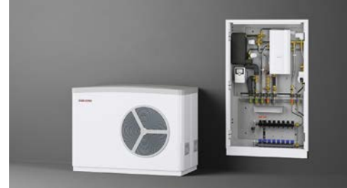
Klug kombiniert: Der zentrale Heizwärmeerzeuger wird durch Wohnungsstationen ergänzt. Das erhöht die Sicherheit, den Komfort und die Transparenz bei der Abrechnung.

Stiebel Eltron setzt mit der Wohnungsstation WS-DUO T Premium auf die schon im Vorgängermodell bewährte Lösung, nicht das komplette benötigte Warmwasser durch den integrierten Durchlauferhitzer zu leiten: So werden Druckverluste im System reduziert und es sind größere Warmwasserleistungen möglich.