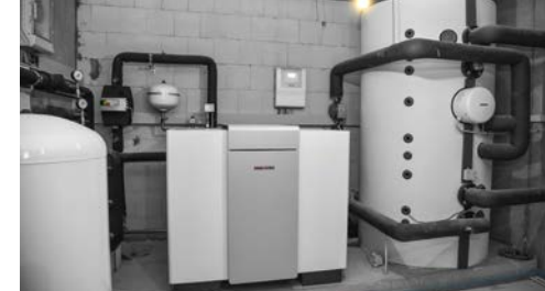
Die Sole-Wasser-Wärmepumpe versorgt als zentraler Wärmeerzeuger das Mehrfamilienhaus mit Wärme und Warmwasser.

Als Wohnungsstationen kommen 13 WSP-2-DUO zum Einsatz – das Vorgängermodell der oben beschriebenen WS-DUO T Premium. Über die Systemtemperatur, die die Wärmepumpe liefert, wird das Trinkwarmwasser auf gut 38 Grad erwärmt. Diese Temperatur reicht für den Großteil der Anwendungen im Haushalt aus. Werden höhere Temperaturen benötigt, kommt der integrierte Durchlauferhitzer ins Spiel.