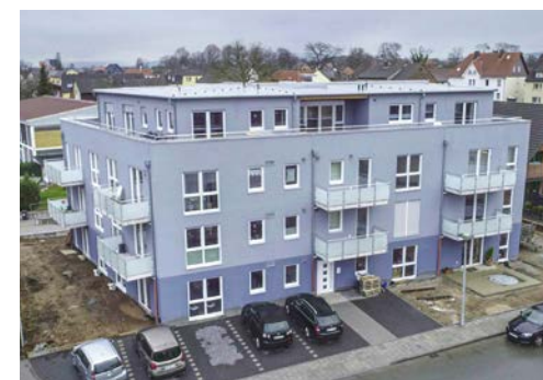
Elf Barrierefreie Wohnungen werden effizient und umweltfreundlich mit einer Kombination aus Wärmepumpe und Wohnungsstation mit Wärme versorgt.

Die niedrige Systemtemperatur von 43 Grad sorgt für einen hocheffizienten Betrieb der Wärmepumpe – die Jahresarbeitszahl der Heizungsanlage wird voraussichtlich bei etwa 5 liegen. Dank der Wohnungsstation kann die von der Wärmepumpe effizient erzeugte Wärme auch für die Trinkwarmwasserbereitung genutzt werden, während der Betreiber gleichzeitig von den Vorteilen einer dezentralen Warmwasserbereitung profitiert.