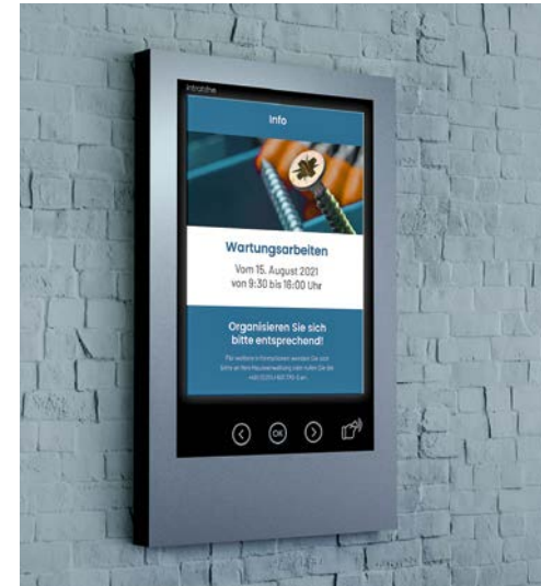
Bewohner aus der Ferne per Online-Übertragung mit aktuellsten Informationen versorgen

Dank modernster Mobilfunk-Technologie ist ein digitales und interaktives Info-Display von Inratone innerhalb weniger Stunden montiert und einsatzbereit. Über die nutzerfreundliche Inratone Online-Verwaltungsplattform lassen sich nach Inbetriebnahme schnell und unkompliziert Informationsaushänge im PDF-, Word- oder JPEG-Format erstellen und mit nur einem Klick an ausgewählte oder gleich an alle mit einem Info-Display ausgestatteten Hausgemeinschaften senden. Bewohner können sich dann mithilfe eines Touch-Bedienfeldes und integrierter Pfeiltasten durch die verschiedenen Aushänge klicken.