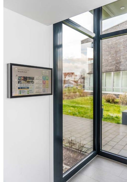
Das Digitale Brett.

Das Digitale Brett ermöglicht im Gegensatz zum klassischen Papieraushang den wechselseitigen Informationsaustausch: Mieterinnen und Mieter haben die Möglichkeit, über das Brett Schadensmeldungen zu senden oder Nachrichten für andere Bewohnerinnen und Bewohner zu hinterlassen. Außerdem können Reinigungs- und Reparaturnachweise oder Informationen wie das Wetter aufgerufen werden. Auch die Einbindung eigener Inhalte – zum Beispiel aus dem Mietermagazin oder der Website – ist einfach möglich.