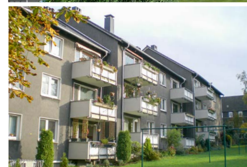
Wichernstraße 14-18 vorher

gung der Mieteinheiten mit Wärme und Warmwasser. Optional können die Mieter einen Stromlieferungsvertrag mit dem Anbieter ecoworks abschließen. Die Stromerzeugung erfolgt mittels PV-Anlage.