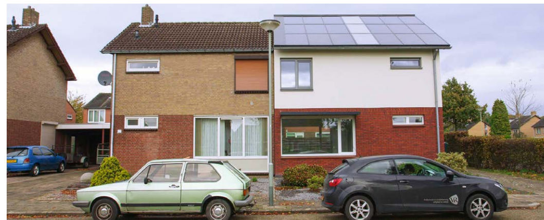
Reihenhaus Niederlande - Vorher/Nachher

Es handelt sich um ein in den Niederlanden entwickeltes neuartiges Sanierungsprinzip für Gebäude. Im Mittelpunkt steht das Erreichen des „Net-Zero-Standards“: Hierbei erzeugt das energetisch sanierte und technisch neuausgestattete Objekt die benötigte Energie für Heizung, Warmwasser und Strom selbst. Die Sanierung erfolgt durch innovative seriell vorgefertigte Bauteile. Dies betrifft sämtliche Fassaden- und Dachelemente, welche bereits werksseitig Dämmung, Fenster, Türen sowie Gebäudetechnik (Lüftungen, Rollläden) erhalten und im Ganzen angeliefert werden. Die Folge ist die Re-