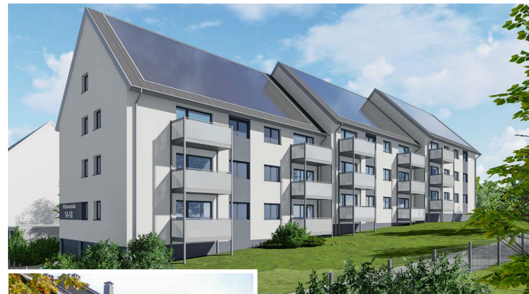
Wichernstraße 14-18 nachher - Visualisierung

Wir haben uns erstmals 2018 mit dem Potenzial dieses Lösungsprinzips beschäftigt. Mehrere unserer strategischen Ziele werden gleichzeitig verfolgt: „Intelligente Modernisierungen“, „Handeln mit sozialer und ökologischer Verantwortung“ und „Nutzen von Innovation als Chance“. Zielgruppengerechte Bestandsbewirtschaftung ist unser Kerngeschäft. Eine Workshopreihe mit Teilnehmern der dena und des Lösungsanbieters ecoworks GmbH aus Berlin hat zur Konzeption eines ersten Pilotprojektes der VBW geführt. Eine Erkenntnis daraus war, dass sich die Sanierungsmethode wegen der einfachen Hülle zunächst für typische Mehrfamilienhäuser der 50er, 60er und 70er Jahre eignet.