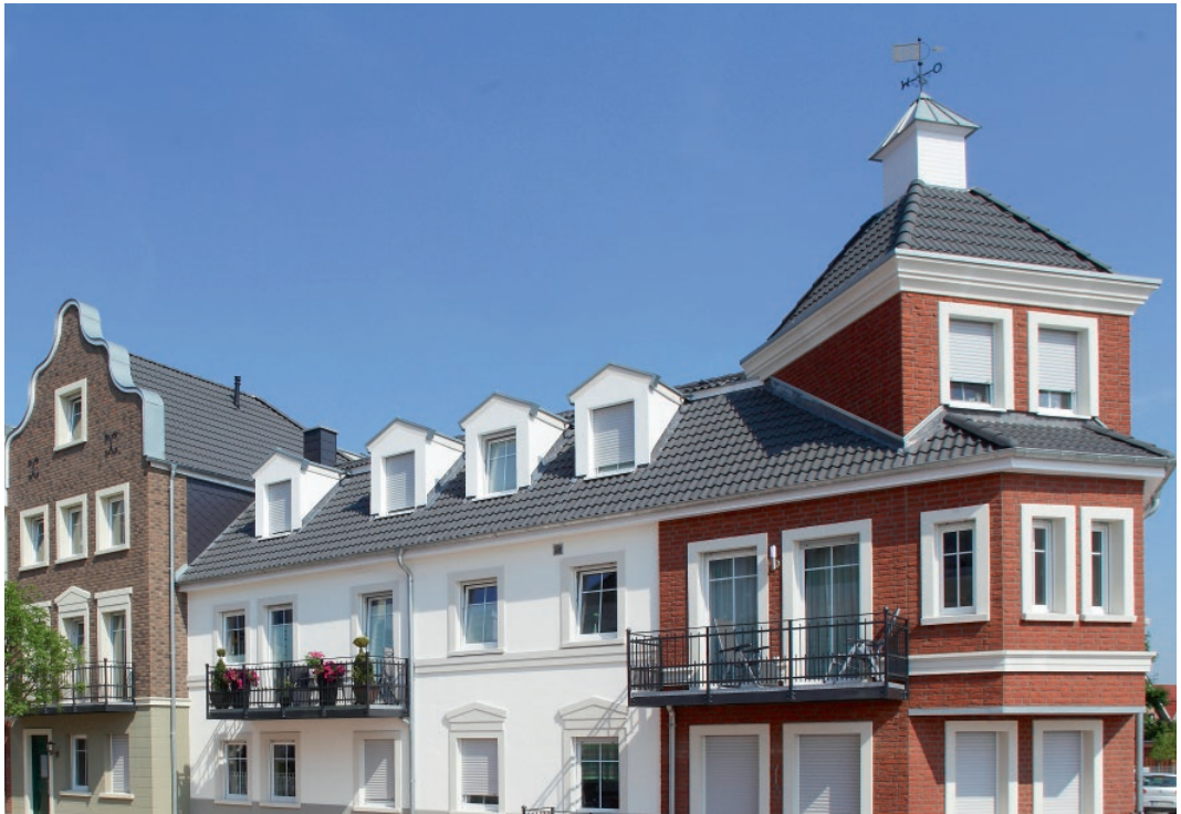
Mehrfamilienhaus mit EasyLife-Eindeckung

Leichte Dachpfanne „EasyLife“: Durch geringes Gewicht ideal für die Sanierung